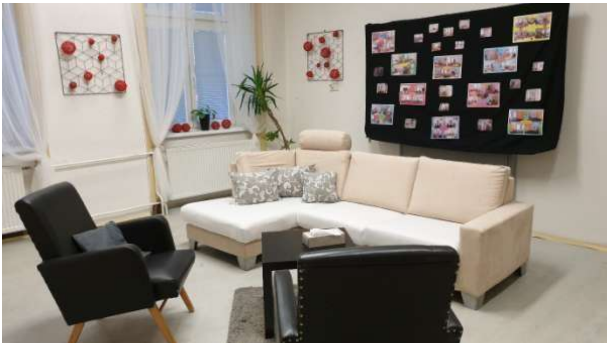
Jednací místnost pro zákonné zástupce žáků