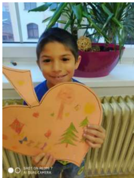
Valentýnská akce-starší žáci pomáhají mladším