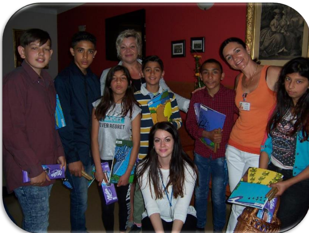
Vystoupení pro seniory