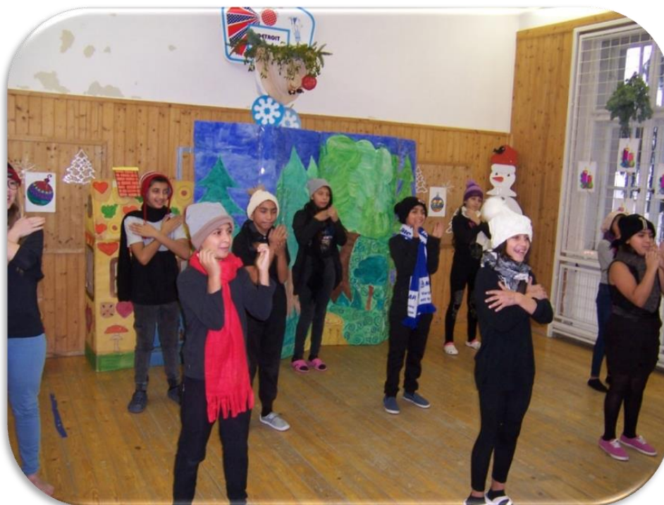
Vystoupení pro rodiče